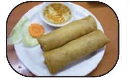
#8. Rouleaux Impériaux