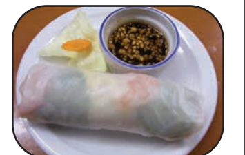
# 9. Rouleau Printemps