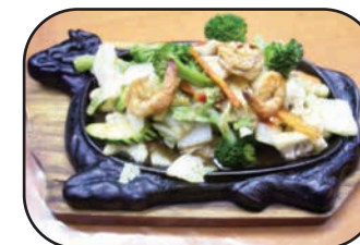
# 80. Plats pétillants

Les prix sont sujets à changer sans préavis