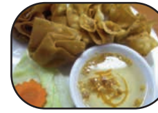
# 7. Phkar (6)